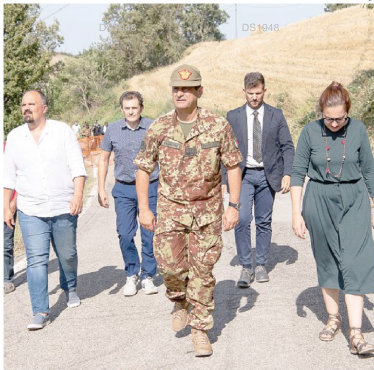
Francesco Paolo Figliuolo. Il generale commissario anti Covid e ora per le alluvioni