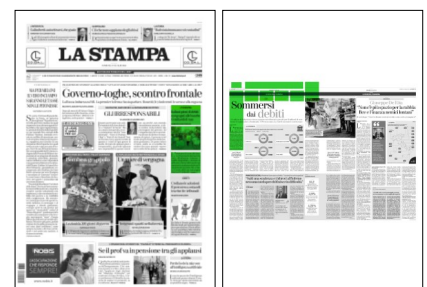
Superficie 85 %

Che questo dei mutui sia un tasto dolente emerge anche dall'ultimo rapporto relativo agli esposti della clientela presentati alla Banca d'Italia reso noto in settimana. Se in tutto il 2022 erano state in tutto 9.200 le segnalazioni (per un terzo riferite a finanziamenti, credito al consumo e mutui) inviate a via Nazionale, in calo del 6% rispetto all'anno prima, nei primi tre mesi del 2023 a via Nazionale ne sono arrivate ben