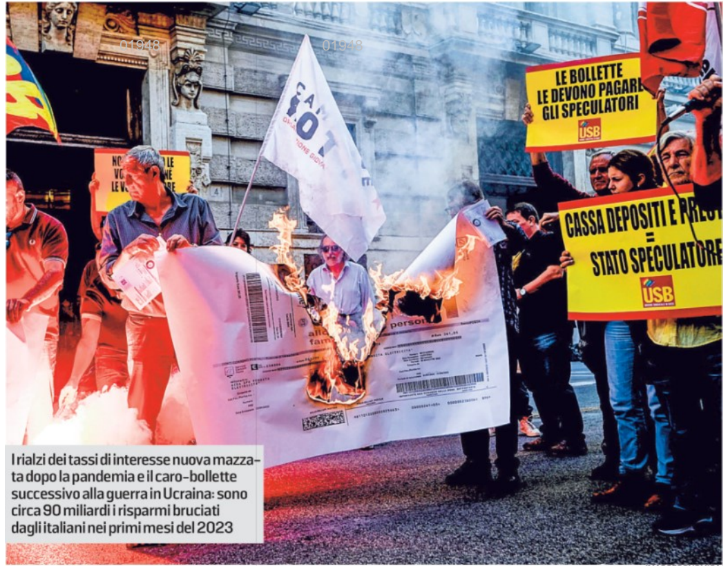
I rialzi dei tassi di interesse nuova mazzetta dopo la pandemia e il caro-bollette successivo alla guerra in Ucraina: sono circa 90 miliardi i risparmi bruciati dagli italiani nei primi mesi del 2023